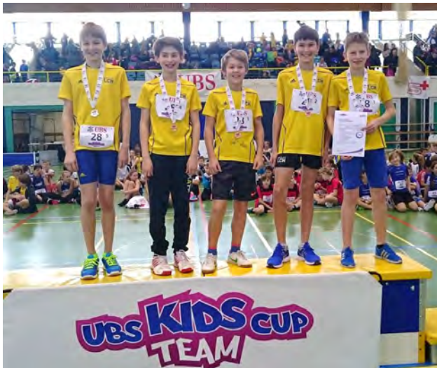
U14-Team UBS Kids Cup Team